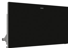
Pannello frontale con vetro ESG nero EXOS.