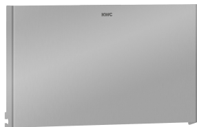
EXOS. Front ze stali chromowo-niklowej

Aksesoria łazienkowe | Uchwyty do papieru toaletowego