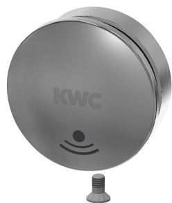
Cappuccio di copertura

Rubinetterie per bagni | Rubinetterie elettroniche