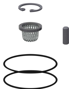
Kit di manutenzione