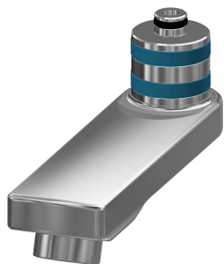
Bocca orientabile, 100 mm

Rubinerie per bagni | Rubinerie temporizzate