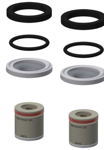
Set de montaje