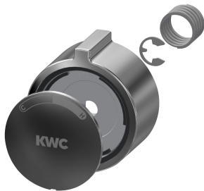
Coperchio a manopola