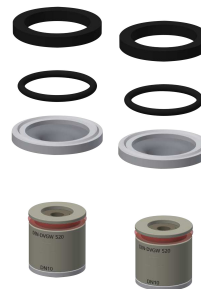
Kit di montaggio