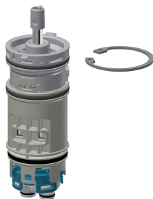
Cartuccia di miscelazione temporizzata FRAMIC