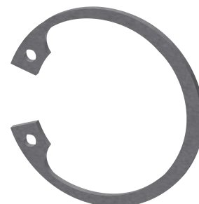
Anello di sicurezza