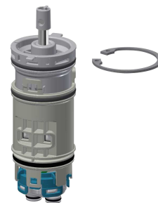
Cartuccia di miscelazione temporizzata FRAMIC