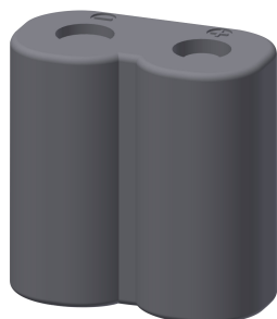
Pile au lithium 6V