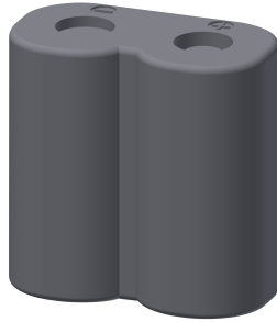
Batteria al litio da 6 V