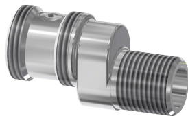
Embout fileté de raccordement