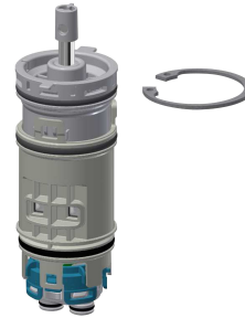
Cartuccia di miscelazione temporizzata FRAMIC