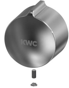
Cappuccio a pressione della manopola