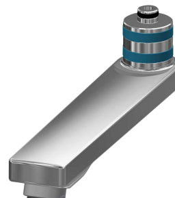
Zwenkuitloop, 160 mm