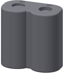
Batería de litio de 6 V