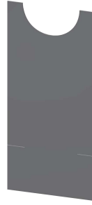
Película de revestimiento