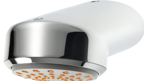
Pommeau de douche AQUAJET-Comfort pour panneaux et installations de douche KWC