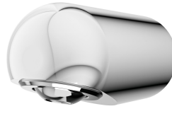
Pommeau de douche MÜNCHEN pour panneaux et installations de douche KWC