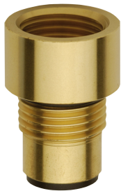
Adaptateur de raccordement