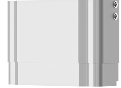
Estensione alloggiamento per pannello doccia F5 in resina MIRANIT