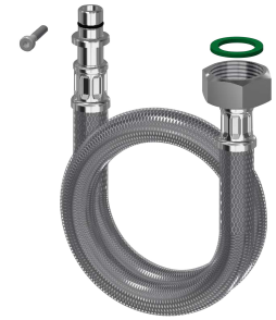
Connecting hose DN10