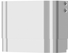
Estensione alloggiamento per pannello doccia F5 in resina MIRANIT