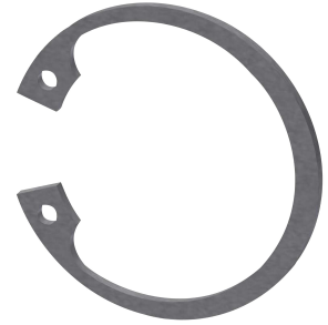
Anello di sicurezza