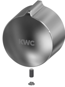
Cappuccio a pressione della manopola