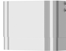
Estensione alloggiamento per pannello doccia F5 in resina MIRANIT