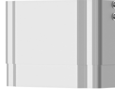
Estensione alloggiamento per pannello doccia F5 in resina MIRANIT