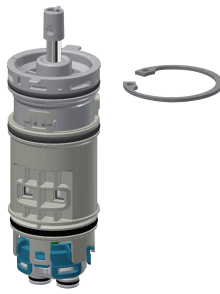
Cartuccia di miscelazione temporizzata FRAMIC