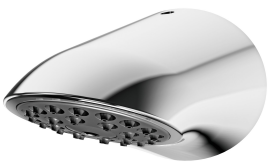
AQUAJET-Slimline-suihkupää KWC-suihkupaneeliin ja -järjestelmiin