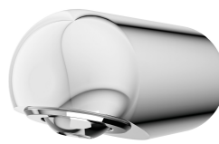
MÜNCHEN-suihkupää KWC-suihkupaneeliin ja -järjestelmiin