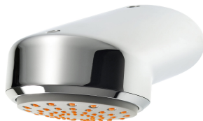
AQUAJET-Comfort-suihkupää KWC-suihkupaneeliin ja -järjestelmiin