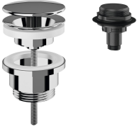
Bonde de vidage à dôme