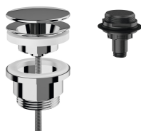
Bonde de vidage à dôme

Modell-Linie: FX | ANMW0036 Lavabos | Lavabos