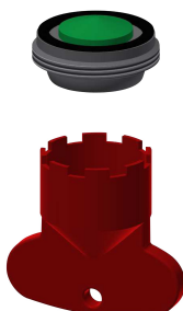
Luftsprudler 5,0 l/min