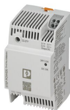
Power supply unit