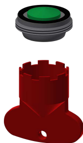
Perlator 5,0 l/min