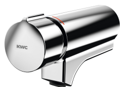
F5S-Mix Självstängande engreppsblandare

Modell-Linie: FITTING-UNITS | AQFU0216 Kranar | Montering av enheter