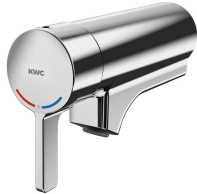
F5L-Therm Einhebel-Thermostat für Armatureneinheit oder Wandflansch