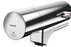
F5E-Mix Elektronik-Waschplatzbatterie für Armatureneinheit oder Wandflansch