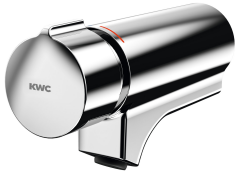
F5S-Mix Selbstschluss-Eingriffsmischer für Armatureneinheit oder Wandflansch

Modell-Linie: FITTING-UNITS | AQFU0217 Wascharmaturen | Armatureneinheiten