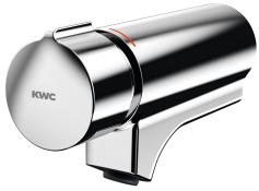
F5S-Mix zelfsluitende eengreepsmengkraan voor armatuureenheid of muurflens