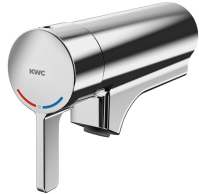
F5L-Therm Termostato monomando para unidad de grifería o brida mural