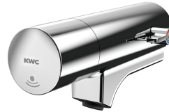
F5E-Mix Batería para zonas de lavabo con sistema electrónico para unidad de grifería o brida de pared