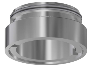
Obudowa do perlatora antykradzieżowego