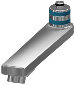
Wylewka obrotowa, 160 mm

Armatura umywalkowa | Armatura jednouchwytowa