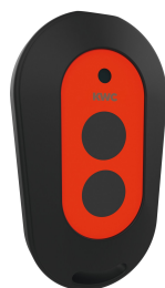
Pilot 2-przyciskowy do armatury F3 i F5