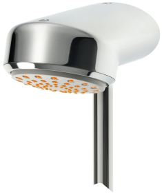
AQUAJET-Comfort shower head