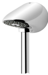
AQUAJET-Slimline Stömlinjeformat duschhuvud