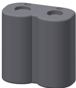
Bateria litowa 6V