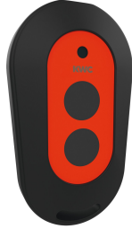
2-Tasten-Fernbedienung für F3 und F5 Armaturen