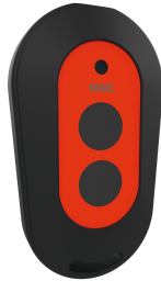
Télécommande à 2 touches