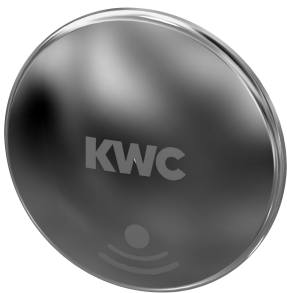
Bouchon de fermeture