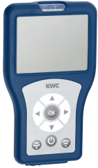
Bidirectional remote control for electronic fittings F3 and F5

Spolssystem | Elektroniska urinoarspolningssystem