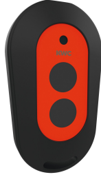
2-button remote control for fittings F3 and F5