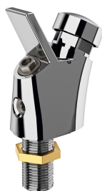
Robinetterie de fontaine à boire ANIMA

Modell-Linie: ANIMA | ANMX33L Fontaines à boire | Fontaine à boire