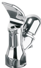
Robinetterie de fontaine à boire