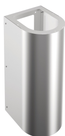
Copri sifone ANIMA