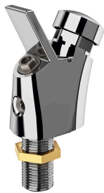
Robinetterie de fontaine à boire ANIMA