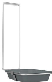
Tacka ociekowa do dozowników MEDCARE