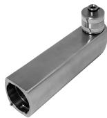
Filteradapter für F5 Wandbatterien