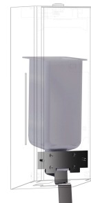
EXOS. Umrüstkit für Flüssigseifenspender