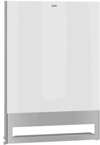
Parte frontal con cristal ESG negro EXOS.