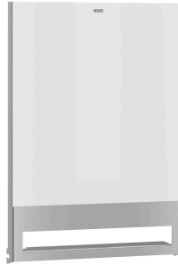
Parte frontal con cristal ESG blanco EXOS.