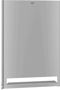
Parte frontal de acero de cromo-níquel EXOS.

Modell-Linie: EXOS | EXO637B | 3600008779 | EAN/GTIN: 7612987159508 Accesorios | Dispensador de papel