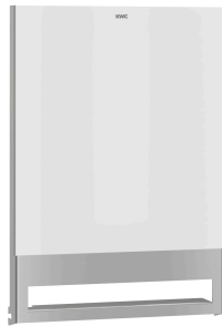
Pannello frontale con vetro ESG bianco EXOS.