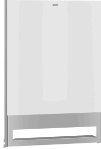
EXOS. Utbytbar frontpanel