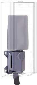
EXOS. Umrüstkit für Schaumseifenspender