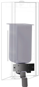
EXOS. Umrüstkit für Flüssigseifenspender