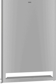
Parte frontal de acero de cromo-níquel EXOS.

Modell-Linie: EXOS | EXO637W | 3600008796 | EAN/GTIN: 7612987159577 Accesorios | Dispensador de papel