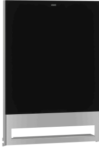
Parte frontal con cristal ESG negro EXOS.