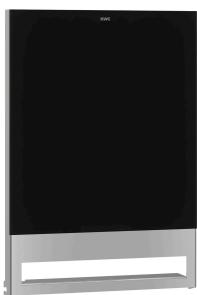
Pannello frontale con vetro ESG nero EXOS.