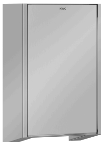
Pannello frontale, acciaio al cromo-nichel