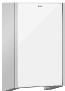
EXOS. frontafdekking met wit veiligheidsglas