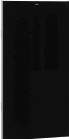
Face avant avec verre trempé noir EXOS.