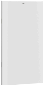
Face avant avec verre trempé blanc EXOS.