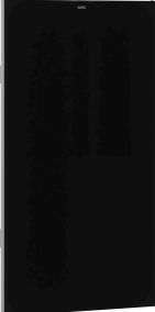
Pannello frontale con vetro ESG nero EXOS.