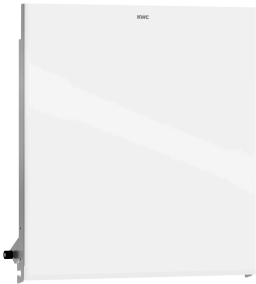
Pannello frontale con vetro ESG bianco EXOS.