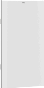
Pannello frontale con vetro ESG bianco EXOS.